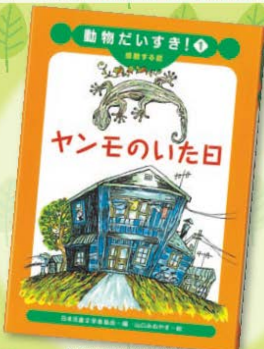
「ヤンモのいた日」(岩崎書店刊)