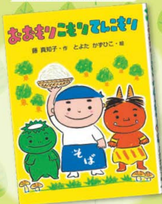
「おおもりこもりてんこもり」(ポプラ社刊)