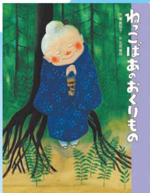
「わっこばあのおくりもの」(ポプラ社)